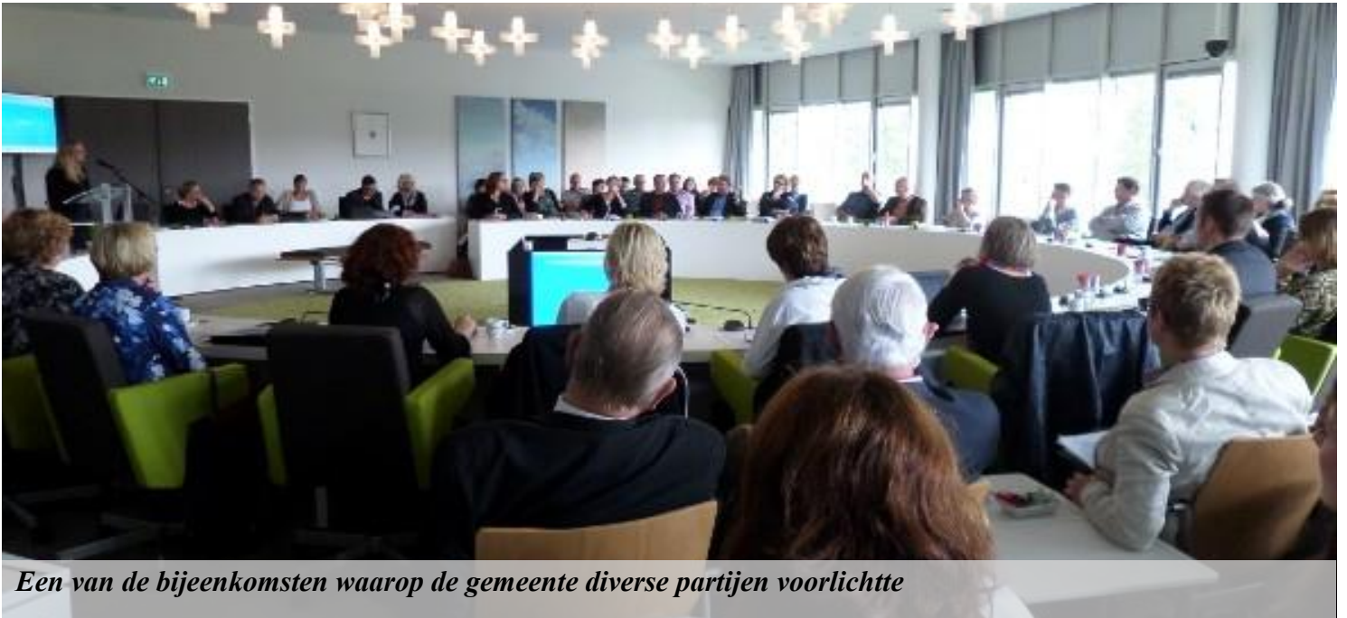
Een van de bijeenkomsten waarop de gemeente diverse partijen voorlichtte