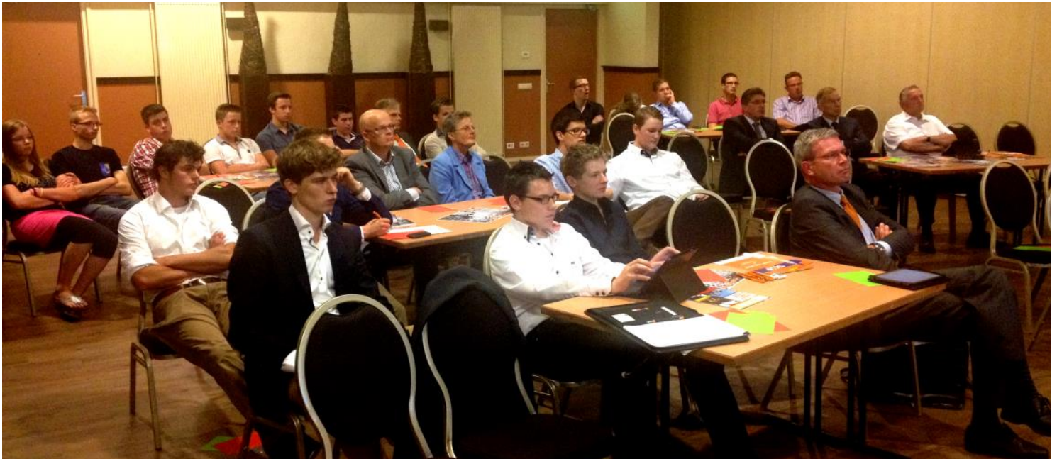
SGP jongeren Goedereede in een bijeenkomst met thema: 'Jeugdwerkloosheid, heb ik straks wel een baan?'