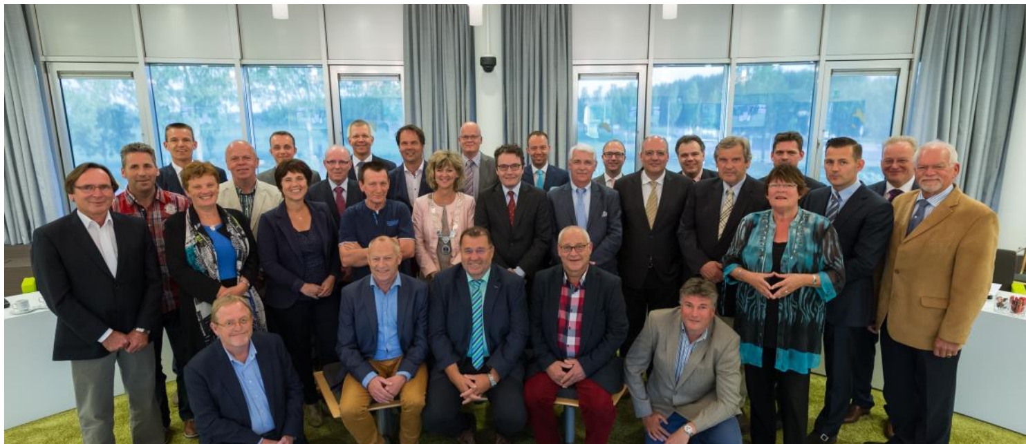
Gemeenteraad van Goeree-Overflakkee maakt keuzes decentralisatie