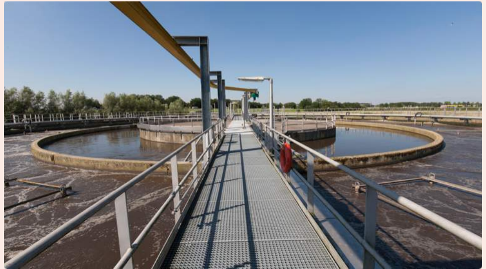
Meer grondstoffen uit rioolwater is mogelijk

Waterschap Hollandse Delta wil in 2030 energieneutraal zijn en in 2050 circulair opereren. Dit laatste betekent dat alle nuttige stoffen in het afvalwater weer hergebruikt moeten worden. De SGP steunt deze ambities van harte en vindt dat het om sommige terreinen nog wel iets ambitieuzer kan. In het geloosde water zitten namelijk ook nog herbruikbare of milieubelastende stoffen, zoals de laatste resten stikstof en fosfaat, maar ook andere zaken. We kunnen denken aan microplastics, medicijnresten en resten van metalen die nu in zee terecht komen. Bovendien kan het zoete water dat uit een zuivering komt ook een nuttig restproduct zijn voor bijvoorbeeld de landbouw.