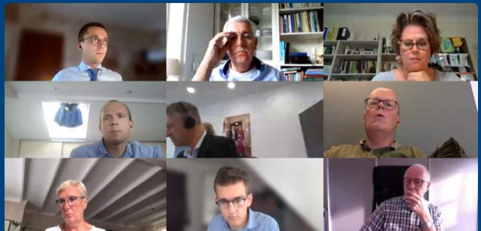
Raadsleden vergaderden in thuisituatie

Het is de bedoeling dat de gemeenteraad in september weer fysiek bij elkaar komt in het bestuurscentrum 'Het Rondeel'. De opstelling van de raadzaal zal drastisch gewijzigd zijn waarbij de 1,5 meter norm zal zijn. Natuurlijk kunt u de raadsvergaderingen live volgen: https://goeree-overflakkee.notubiz.nl/