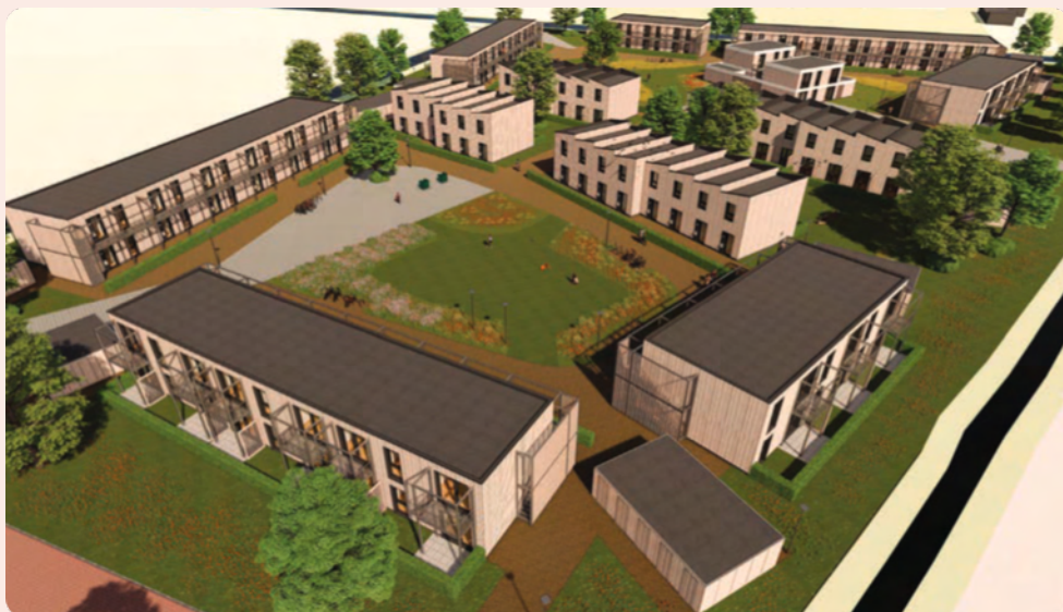
Impressie van Flexwoningen tbv huisvesting Oekraïners

Flexwoningen zijn modulaire gebouwen die met behulp van kant en klare bouwstenen in elkaar worden gezet. Ze zijn ook daadwerkelijk flexibel, want ze blijven demontabel. Dat is ook nodig. Procedures voor tijdelijke woningen zijn namelijk korter omdat deze gebouwen een 'tijdelijk' karakter hebben. Ze worden geplaatst voor maximaal 10 jaar. De woningen zelf kunnen echter 40 jaar mee. Daardoor moeten ze dus verplaatsbaar zijn. De woningen, waar woningbouwvereniging Oost West Wonen momenteel aan de slag mee gaat, zijn zulke flexwoningen. Ze zijn nog eens betaalbaar ook. Voor ongeveer €200.000,- is het al mogelijk om zo'n woning te realiseren.