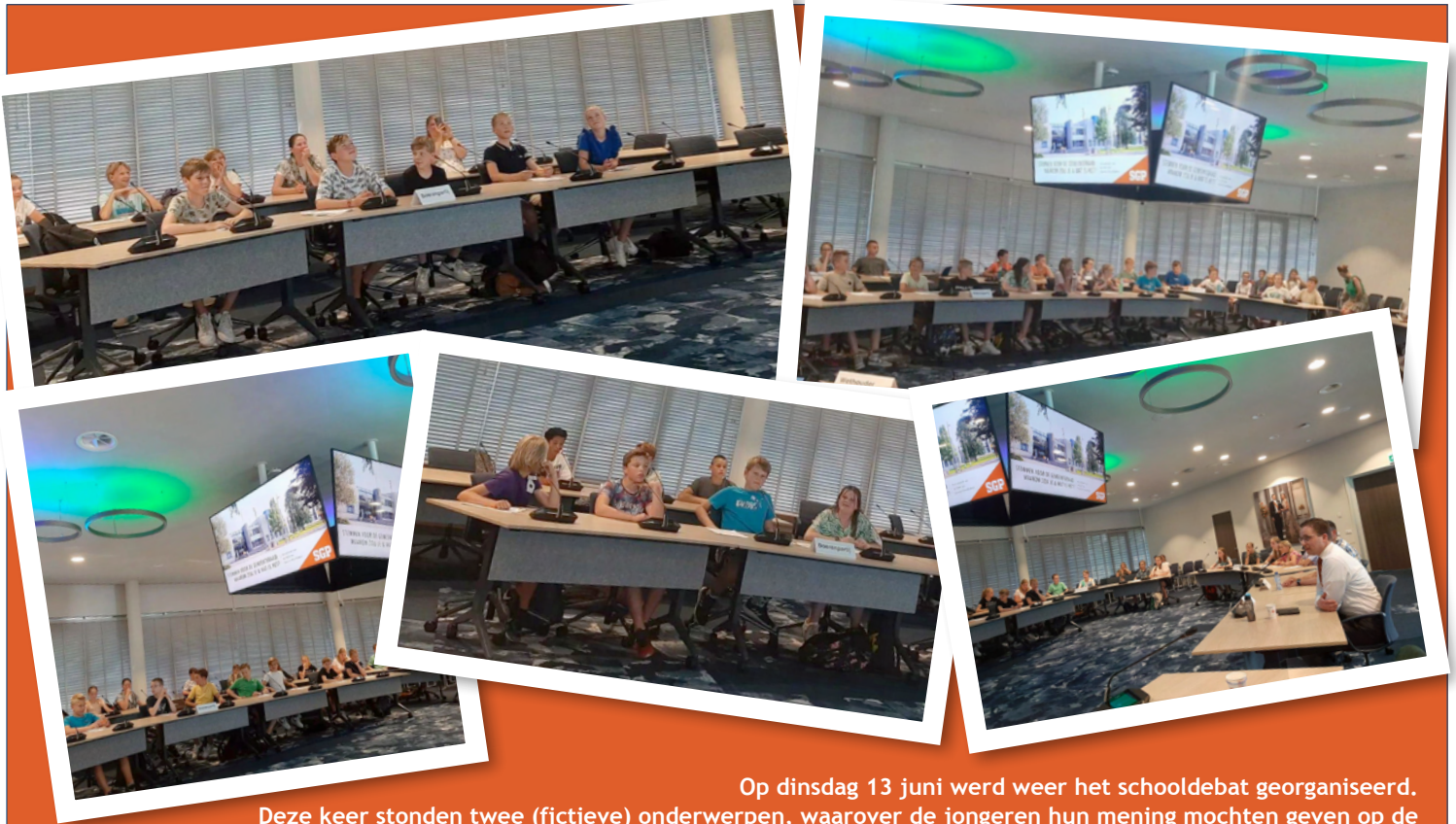
Op dinsdag 13 juni werd weer het schooldebat georganiseerd. Deze keer stonden twee (fictieve) onderwerpen, waarover de jongeren hun mening mochten geven op de agenda: Het bouwen van een nieuw zwembad in Oude-Tonge en de realisatie van een Warmtenet in Stellendam. Te gast waren leerlingen van de School met de Bijbel Koningin Beatrix uit Ouddorp en van de Christelijke basisscholen Het Kompas en Zomerland uit Stellendam.