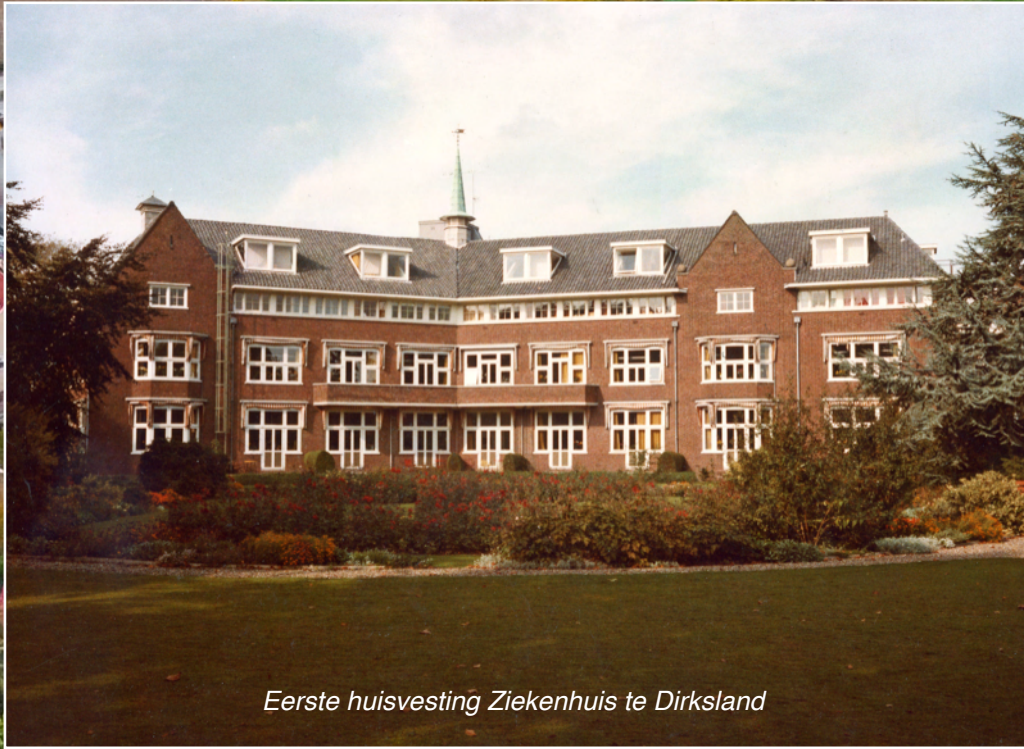
Eerste huisvesting Ziekenhuis te Dirksland